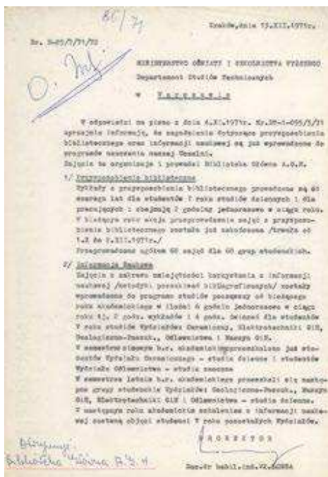
Pismo rektora Longi do ministerstwa, 1971 rok