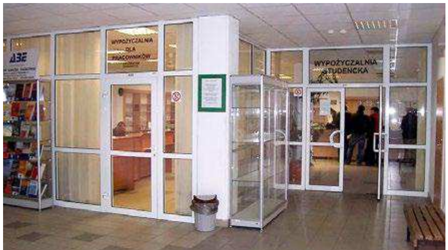
fol. J. Rzepczyński