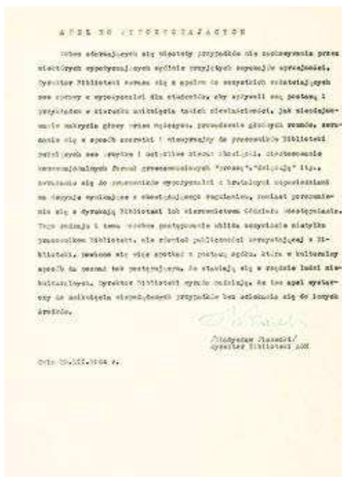
Apel do wypożyczających dyr. W. Piaseckiego