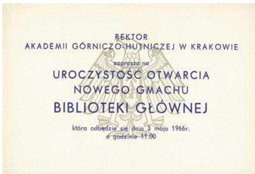
Zaproszenie na otwarcie budynku Biblioteki Główniej, 1966 rok

Przemianowanie najstarszego Wydziału Górniczego na Wydział Górnictwa i Geoinżynierii Akademii Górniczo-Hutniczej dokonane w 2002 roku sprawiło, że jedyną jednostką organizacyjną w naszej uczelni o niezmienionej od swego powstania nazwie pozostaje, działająca od roku akademickiego 1921/1922, Biblioteka Główna.