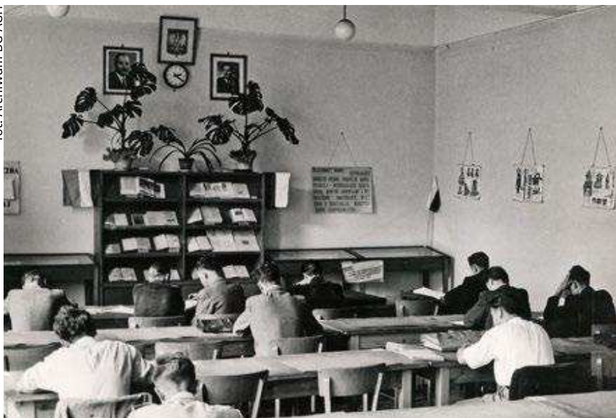
Czytelnia ogólna w budynku A-0, 1953 rok