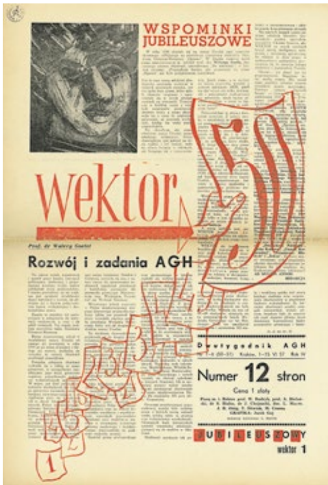
fot z lewej: Wektor: dwutygodnik AGH 1957 nr 7-8